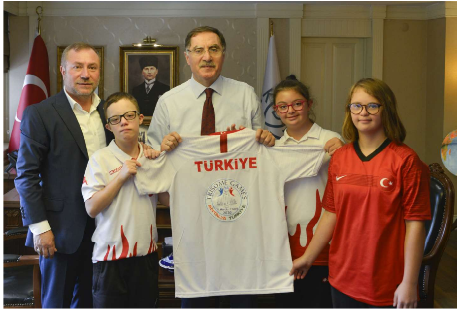
Türkiye Özel Sporcular Spor Federasyonu Başkanı ve milli sporcularımızın Başkanetçi ziyareti, 2019.

2020 yılı içinde KDK çocuk internet sayfasına erişim sağlayarak başvuru yapan çocukların başvurularında; Pandemi döneminde uzaktan eğitim sürecinde derslere erişim sorunları, ebeveynlerinin işsiz kalması ya da ücretsiz izinde olması gibi nedenlerle hane gelirinin azalması veya yetersiz kalması gerekçeleriyle sosyal yardım ve ihtiyaç kredisi taleplerinde artış kaydedildiği izlenmiştir. Bu doğrultuda başvuru içeriğine göre ilgili Valilik, Kaymakamlık ve Belediyeler başta olmak üzere idarelerle iş birliği içerisinde başvuruların